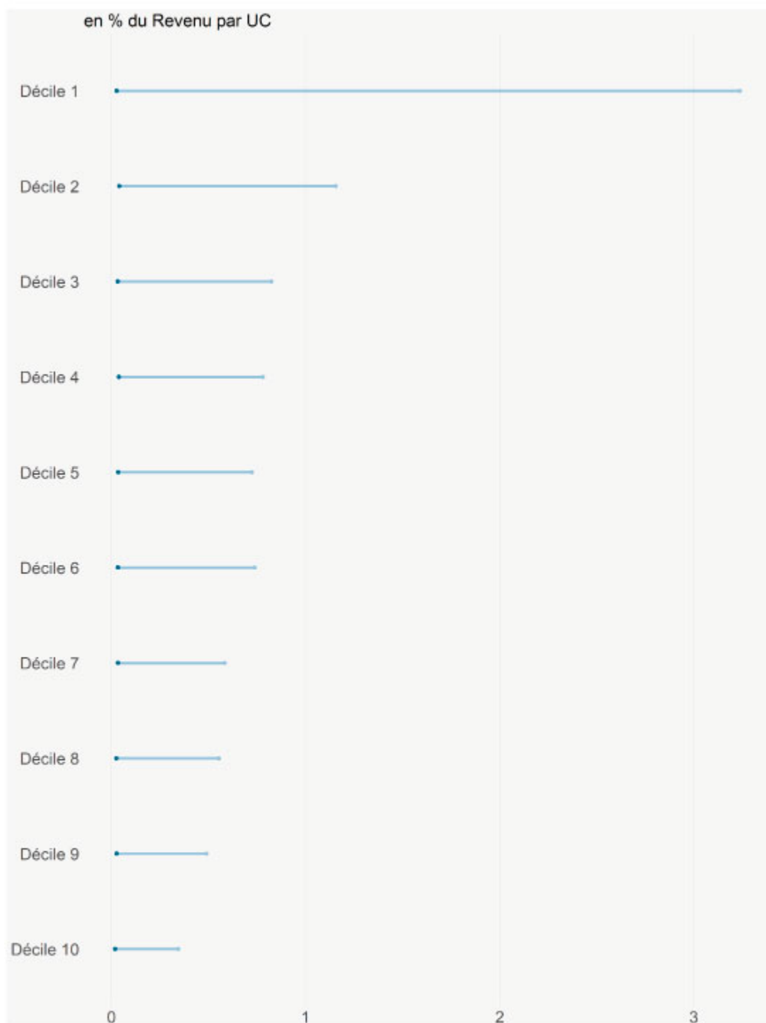
Graphique 2. Écart interdécile de l'impact budgétaire d'une taxe carbone de 44,6 € sur les combustibles pour chaque décile de revenu

Lecture du graphique : Parmi les ménages du 1er décile, les 10 % les moins impactés par la contribution carbone de la TICPE y consacrent 0,1 % de leur revenu, contre 3,4 % pour les 10 % les plus impactés.