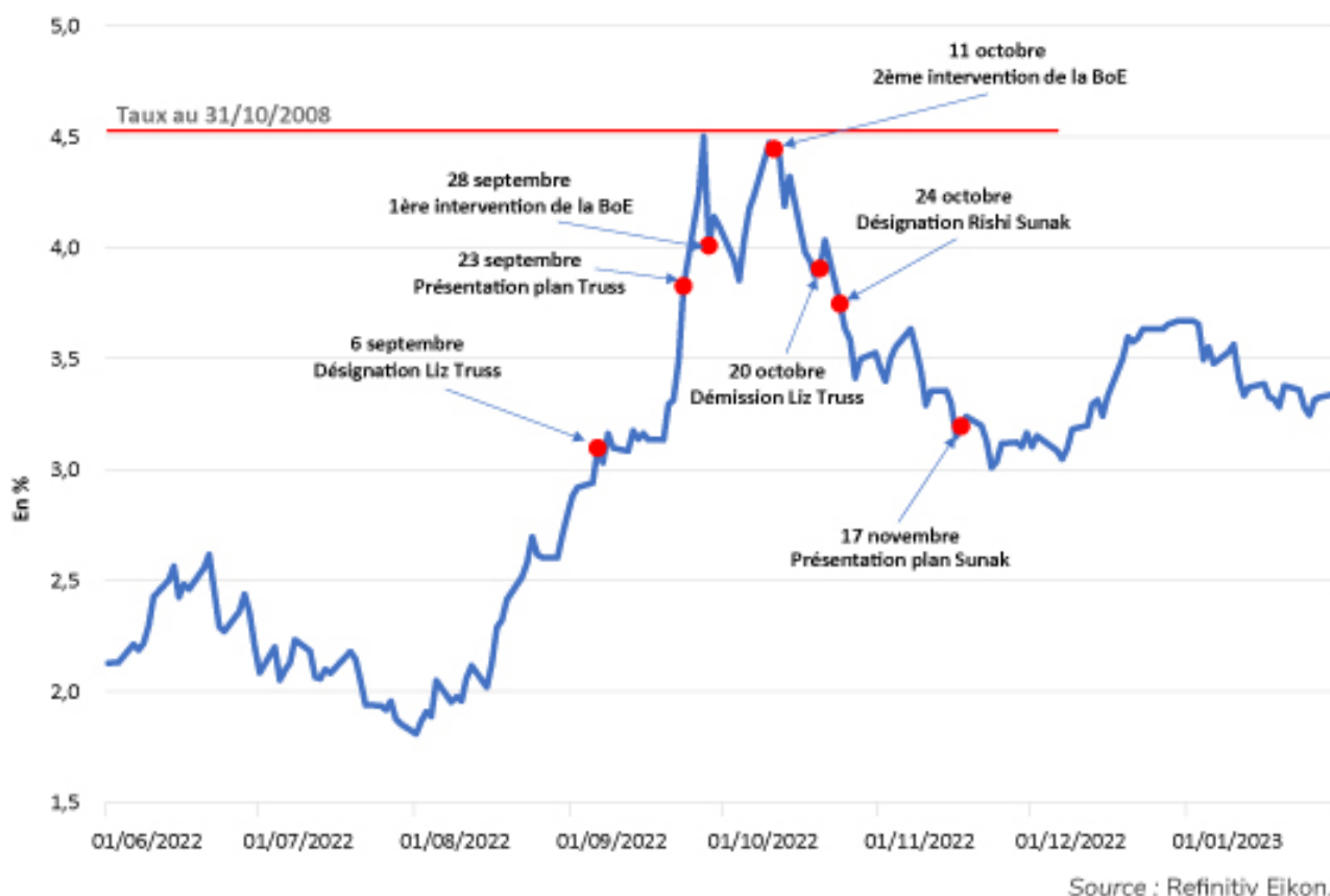
Graphique 2. Rendement des obligations d'État à 10 ans au Royaume-Uni

[1] Au Royaume-Uni, l'exercice budgétaire commence le 1 er avril et se termine le 31 mars de l'année suivante.