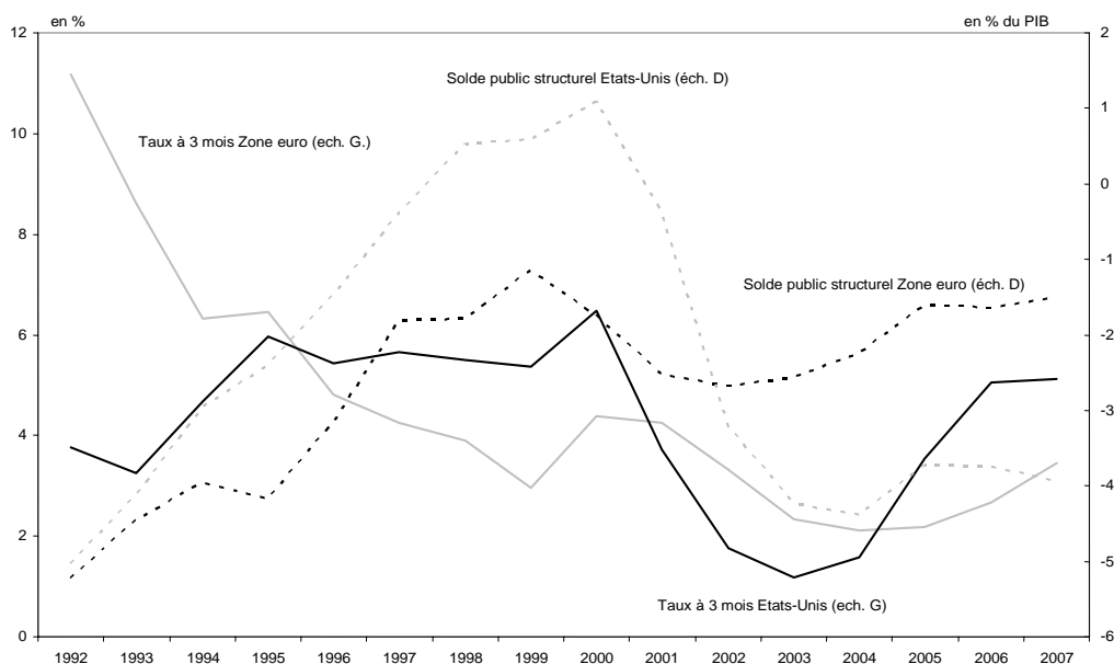
Graphique 2. Politique monétaire et budgétaire aux Etats-Unis et dans la zone euro

Cependant, les Etats-Unis ont, malgré la multitude de chocs subis, su éviter une récession majeure et sont parvenus à maintenir une croissance à 2% grâce à une politique économique très volontariste : la Réserve fédérale américaine (Fed) a en effet baissé ses taux directeurs de près de 5 points entre 2000 et 2002 et l'impulsion budgétaire a représenté quasiment 4,5 points de PIB (graphique 2). L'Europe a bien sûr également été touchée par l'explosion de la bulle Internet, mais l'ampleur du choc a été de moindre ampleur, et elle n'a pas eu à faire face à des attaques terroristes et des scandales financiers comparables. Enfin la suraccumulation de capital opérée aux Etats-Unis pendant la deuxième moitié des années 1990 ayant été beaucoup plus forte qu'en Europe, l'ajustement opéré pendant la période post-bulle par les entreprises sur l'investissement a été beaucoup plus drastique aux Etats-Unis que de l'autre côté de l'Atlantique. Au final, l'Europe a été plus préservée que les Etats-Unis du retournement financier mondial, ces derniers subissant de plein fouet les modifications du comportement des investisseurs. Si l'écart entre les deux zones ne s'est pas plus creusé à ce moment là, c'est en grande partie lié au policy mix européen beaucoup plus mou que celui américain.