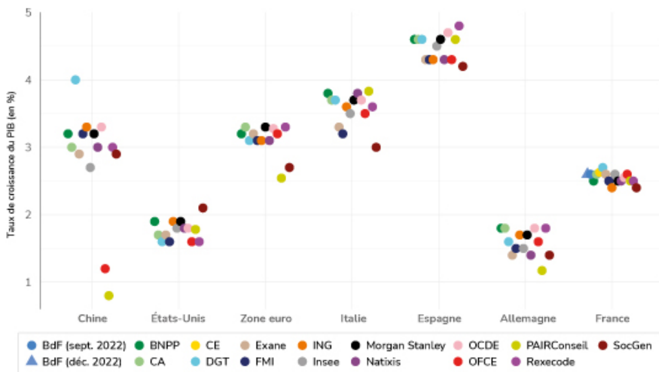
Graphique 1. Prévisions de taux de croissance pour 2022

reste positif avec une prévision moyenne à 0,5 % mais l'incertitude demeure importante.